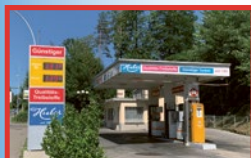
Emmenbrücke Neuenkirchstrasse 26