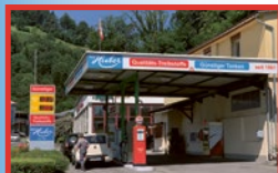
Kriens-Obernau Renglochstrasse 50