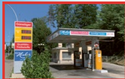
Emmenbrücke Neuenkirchstrasse 26