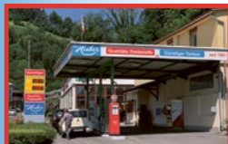
Kriens-Obernau Renglochstrasse 50