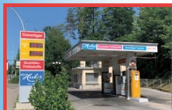
Emmenbrücke Neuenkirchstrasse 26