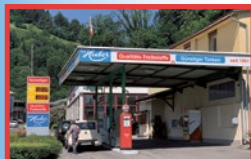
Kriens-Obernau Renglochstrasse 50